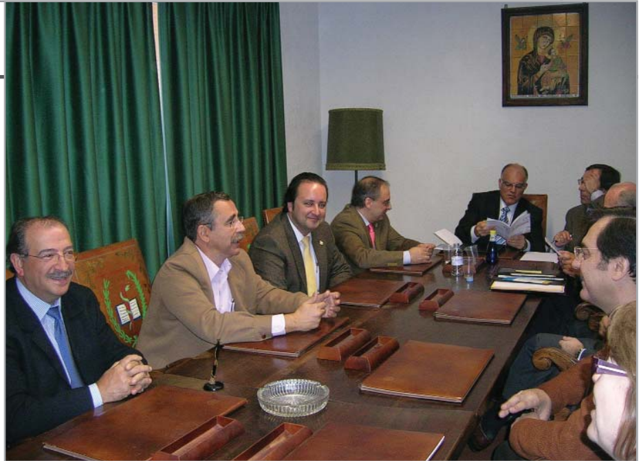
Al acto de traspaso de la presidencia asistieron los presidentes de los Colegios de Médicos de las cinco provincias castellano-manchegas, tres vocales autonómicos y cuatro miembros de la Comisión Deontológica Autonómica

Hizo, además, un repaso de otros logros conseguidos hasta ahora por el Consejo Autonómico de Colegios Médicos de Castilla La Mancha, como el pionero servicio de videoconferencias por el cual se están interesando otros Consejos Autonómicos y Colegios Médicos. Este sistema permite llevar a cabo cursos y reuniones on line, constituyendo una herramienta