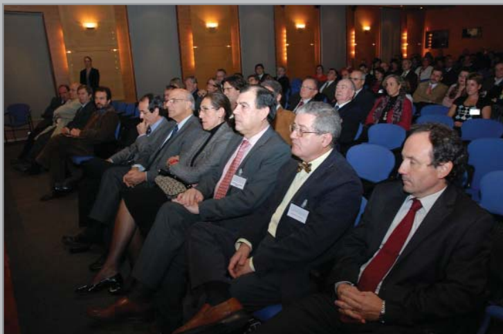
Asistentes al III Congreso Nacional PAIME, celebrado en Barcelona del 12 al 14 de noviembre

implicación por parte de los Colegios en el desarrollo de instrumentos colegiales para la limitación y/o tutela de los casos de riesgo de mala praxis.